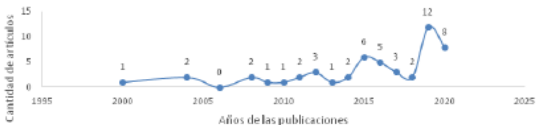
Figura 2: Número de publicaciones por año sobre temas relacionados al objeto de investigación

Ahora bien, el número de publicaciones sobre los temas de Empoderamiento de la mujer, emprendimiento femenino, e innovación femenina demuestran que el interés por estos temas viene siendo constante en estas revistas científicas internacionales y está muy relacionado con la sociología, la psicología, la administración y los estudios de investigaciones libres. En la figura 2 descrito a continuación, se muestra un crecimiento en el interés por estos temas, sobre todo en los últimos cinco años, llegando en el 2019 a realizarse 12 publicaciones. Y lo que va del 2020 contar con ocho publicaciones y con posibilidades de aumento de ese número, considerando que la revisión de literatura fue concluida en el mes de junio 2020.