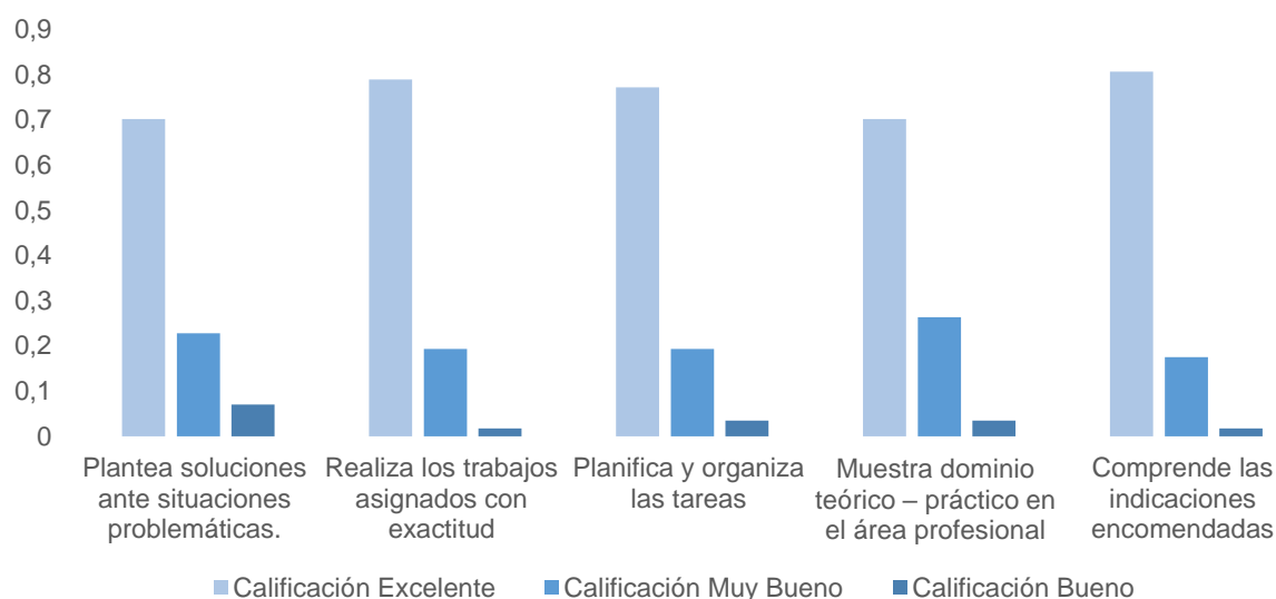
Figura 2. Evaluación de los conocimientos de los estudiantes de la carrera de economía de la Facultad de Ciencias Económicas de la Universidad Nacional de Asunción. Año 2021