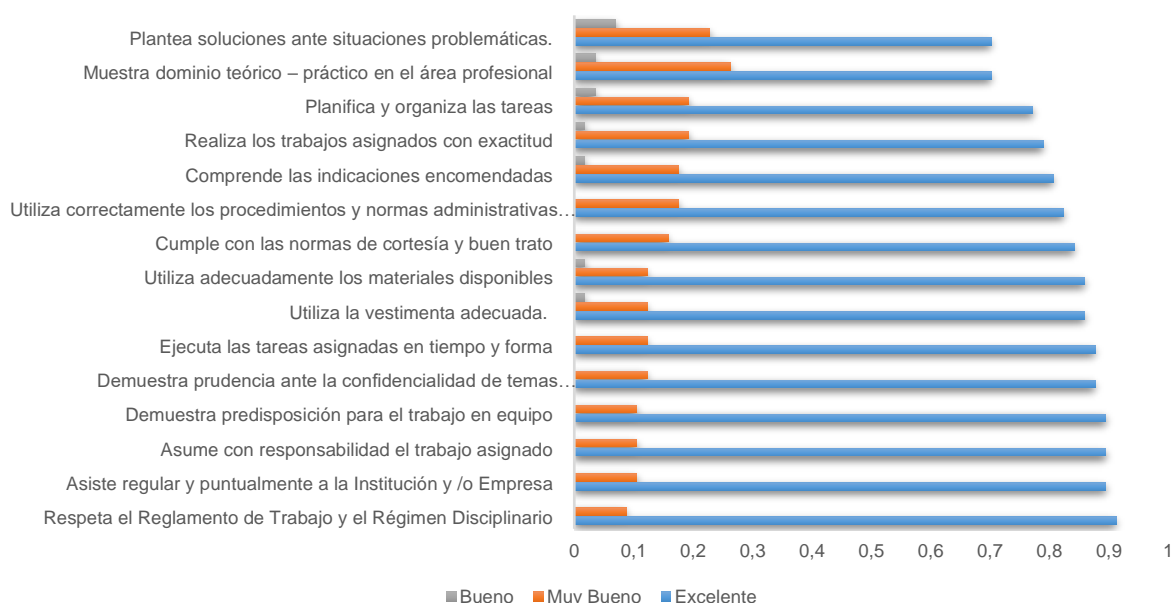
Figura 4. Evaluación de las competencias de los estudiantes de la carrera de economía de la Facultad de Ciencias Económicas de la Universidad Nacional de Asunción. Año 2021