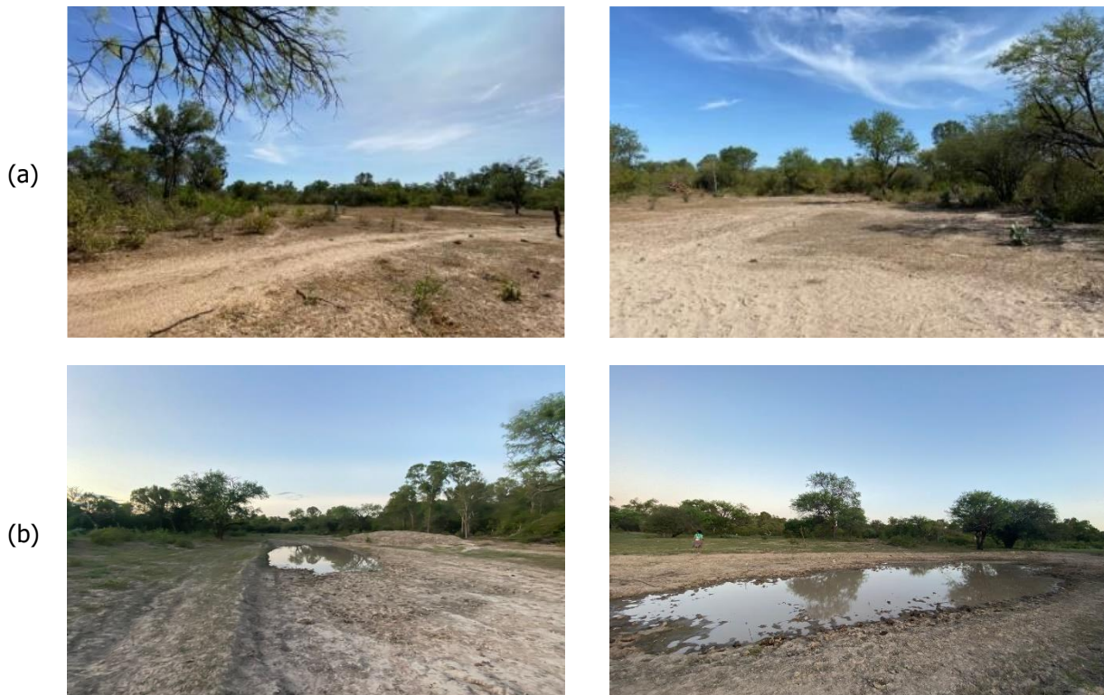
Figura 2. a) Imágenes de la aguada Marité obtenidas el 26 de enero de 2022, b) Imágenes de la aguada Marité obtenidas el 04 de marzo de 2022.