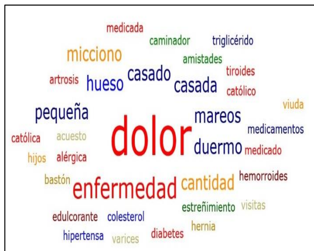
Figura 1. Nube de palabras, Necesidades de los adultos mayores, n= 10. Fuente: datos recabados mediante entrevista semiestructurada, análisis de contenido con Atlas Ti versión 9.

Las palabras que fueron repetidas con mayor frecuencia en el discurso de cada participante fueron: dolor y enfermedad, seguida de medicamento, medicamentos, diabetes, edulcorante, estreñimiento, hipertensa y otras palabras relacionadas a enfermedades crónicas no trasmisibles, por lo que resultaron evidentes las necesidades directamente relacionadas con sus patologías de base (Figura 1).