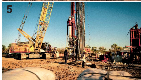
Figuras 4-5) Gestión y obras en Carmelo Peralta. 4) Comitiva mesa de trabajo CB y autoridades locales de Carmelo Peralta. 5) Construcción del puente Internacional con Brasil, localidad Carmelo Peralta.