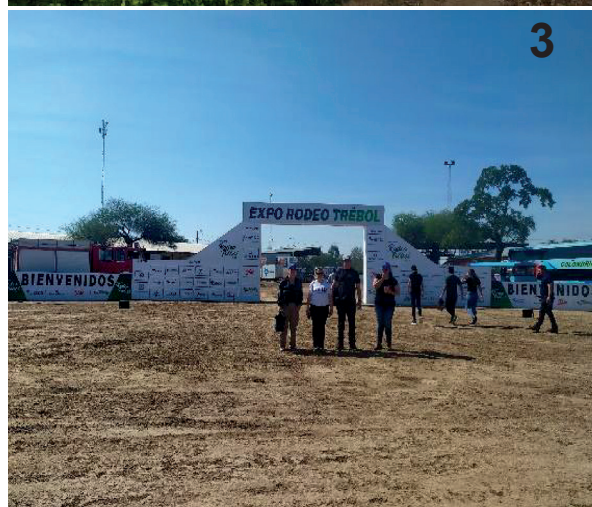
Figuras 2-3) Puntos de interés de la ruta bioceánica. 2) Portal de la Libertad, Filadelfia. 3) Expo Rodeo Trébol, Loma Plata.

todo el proceso de la elaboración de este producto hasta llegar al consumidor.