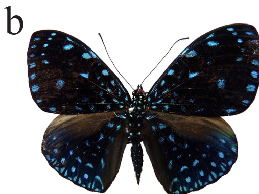
Figura 1. Ejemplares de Hamadryas laodamia . a) Ejemplar vivo in situ : Parque Nacional Cerro Corá, Octubre 2010. b) Ejemplar montado proveniente de Laguna Blanca (Colección CZPLT-E).