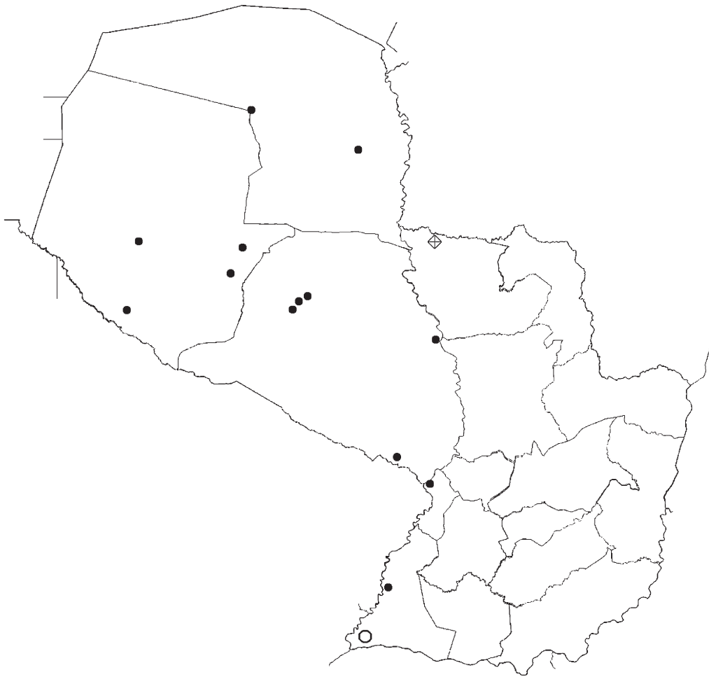
Figura 2. Localidades de presencia de Leptodeira annulata en Paraguay. Círculos negros: localidades previamente conocidas y confirmadas con ejemplares de referencia. Círculo blanco: localidad referida en bibliografía. Rombo: nueva localidad mencionada en la presente contribución.

Batrachien aus Paraguay. Zeitschrift für Naturwiss, 58:213-248.