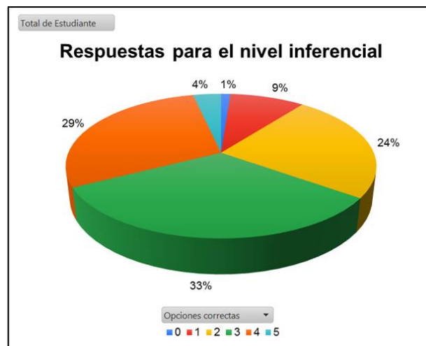
Figura 2. Para el nivel inferencial de la comprensión lectora

En la Figura 2 se visualiza que el 1% de la población no seleccionó correctamente ninguna de las cinco opciones propuestas para medir el nivel inferencial, el 9% de la población seleccionó una opción correcta, el 24% dos opciones correctas, el 33% tres opciones correctas, el 29% cuatro opciones correctas y el 4% de la población seleccionó correctamente las cinco opciones propuestas para medir este nivel.