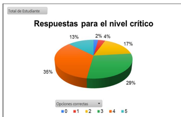
Figura 3. Nivel Crítico de la comprensión lectora

En la Figura 3 se observa que el 2 % de la población no seleccionó correctamente ninguna de las cinco opciones propuestas para medir el nivel inferencial, el 4 % una correcta, el 17 % dos correctas, el 29 % tres correctas, el 35 % cuatro correctas y el 13 % seleccionó correctamente las cinco propuestas para medir este nivel.