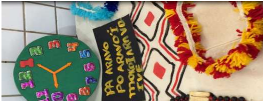
Figura 1: Materiais expostos em uma feira de ciência e cultura em uma escola indígena de Dourados.

bens materiais e simbólicos, mas como capacidade de realizar agenciamentos, de gerar espaços de construção de sentido que envolvem conhecimentos de tempo, de espaço, de causalidade, de quantidades, etc. elaborados em culturas diferentes.