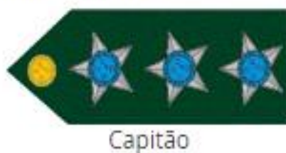
Exército Brasileiro. Postos e Graduações, 2022