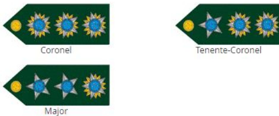
Exército Brasileiro. Postos e Graduações, 2022