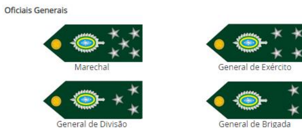
Exército Brasileiro. Postos e Graduações, 2022