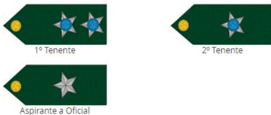
Exército Brasileiro. Postos e Graduações, 2022