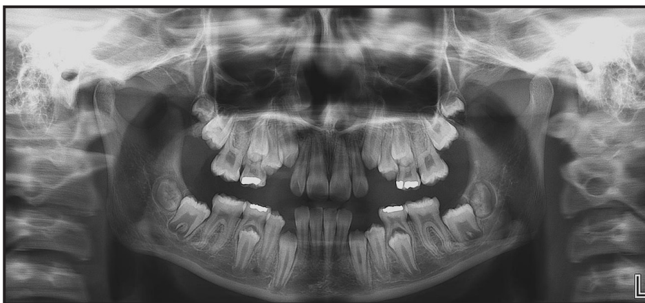
Figura 2. Segunda radiografía panorámica, con fecha de 28/12/2016. Nótese el avance a través del hueso alveolar de los dientes superiores e inferiores.