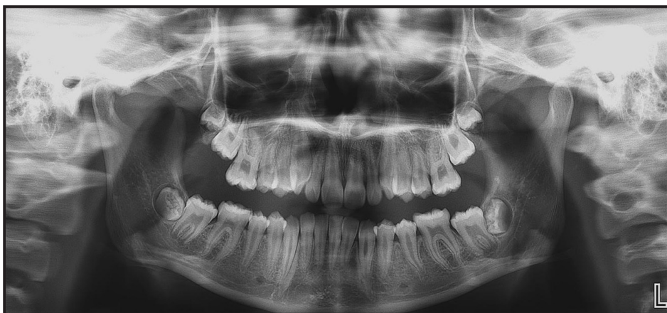
Figura 4. Cuarta radiografía panorámica con fecha de 20/4/2018. Nótese la evolución completa de la zona de sostén de Korkhaus. Los segundos molares inferiores presentan retención causada por los terceros molares inferiores.