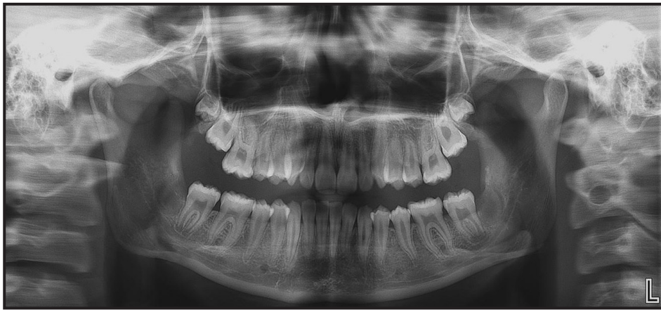
Figura 5. Quinta radiografía panorámica con fecha de 9/11/2018. Se observa la erupción de todos los dientes permanentes exceptuando los segundos y terceros molares superiores.