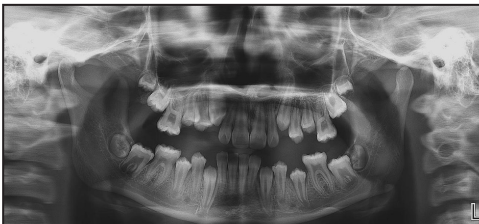
Figura 3. Tercera radiografía panorámica, con fecha de 24/5/2017. Nótese mayor avance a través del hueso alveolar de todos los dientes permanentes en relación a la zona de sostén de Korkhaus.