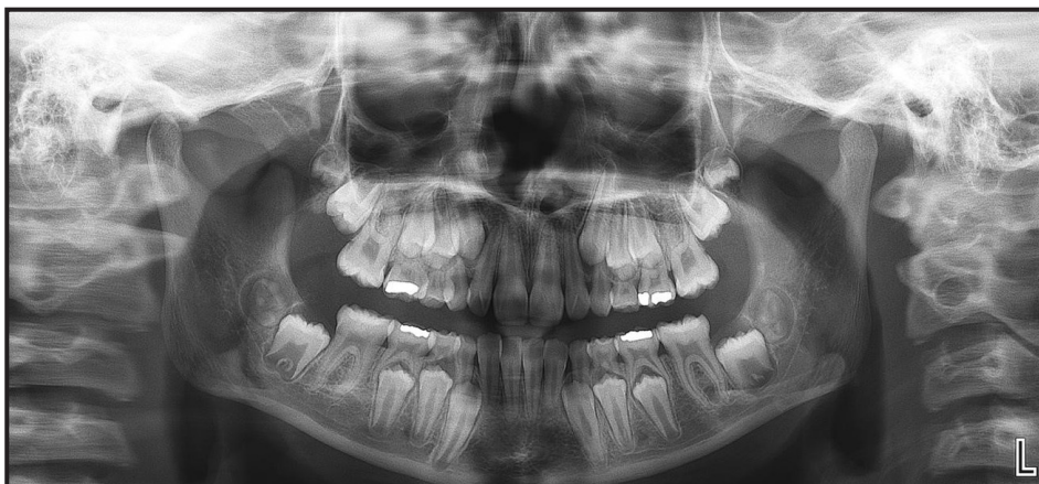
Figura 1. Radiografía panorámica inicial con fecha de 20/6/2016. Muestra gran desarrollo radicular de dientes permanentes y escasa reabsorción radicular en caninos y molares temporales.

Las interacciones de dichas moléculas se encuentran localizadas en el folículo dental y en el retículo estrellado del diente en formación. Ambas estructuras son las encargadas, mediante las interacciones que entre ellas se establecen, de generar el proceso eruptivo del diente.