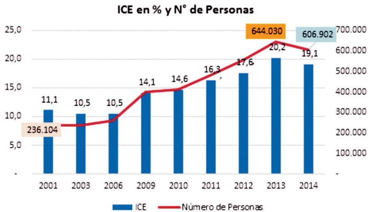
Figura 1. Evolución del ICE en el periodo 2001-2014

Fuente: Elaboración propia con datos de la DGEEC.