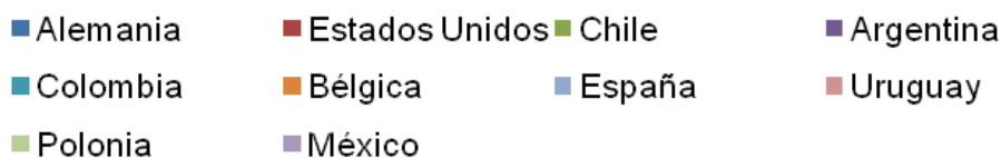
Figura 1. Estudiantes de la FCE-UNA movilizados.