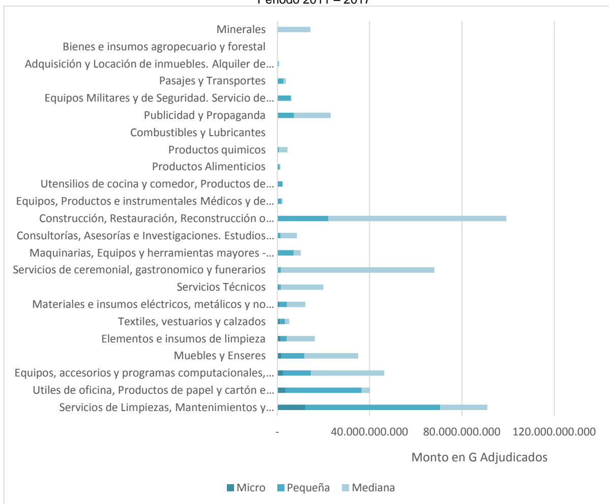
Gráfico 2: Categoría del bien o servicio prestado* Categoría de la empresa, Período 2011 – 2017