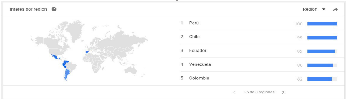
Figura 2. Interés de búsqueda sobre el término “Lactancia materna” por región a nivel global durante los últimos 5 años usando Google Trends®

cial es un valor fundamental que se traduce en un mayor interés en las personas sobre el tema. Los países que presentaron mayor interés en la búsqueda sobre “Lactancia materna” por región a nivel global durante fueron principalmente Perú y Chile, seguidos por otros países de Latinoamérica ( Fig. 2 ).